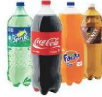
2L Plastiek bottels | 2L Plastic bottles

60 Blikkies | Tins = 1Kg 30 Blikkies | Tins = 0,5Kg