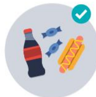
Food at Events