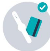
Tuckshop with Tags

Join the following leading schools (amongst 500+ others who have also signed up) in the drive for safer, more efficient schools: