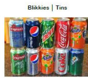
Blikkies | Tins

60 Blikkies | Tins = 1Kg 30 Blikkies | Tins = 0,5Kg